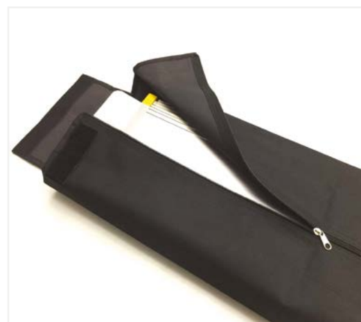
■ Borsone per AG 107 (optional) Bag for AG 107 (optional)