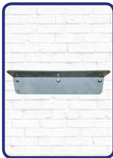
■ Attacco muro Wall bracket