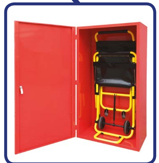
■ Cover Cover per fissaggio a muro Cover Cover for standing against the wall