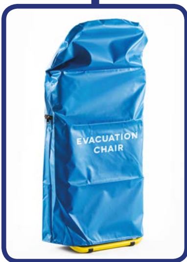
■ Cover Cover per fissaggio a muro Cover Cover for standing against the wall