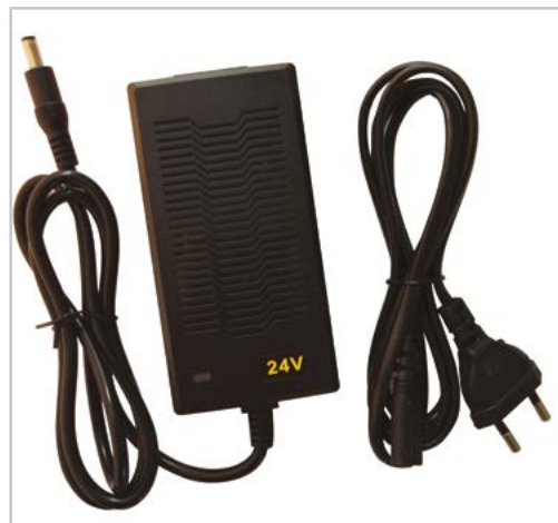
■ Batteria e carica batteria Battery and battery charger