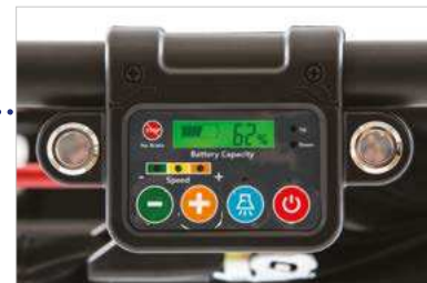
■ Quadro comandi Control panel