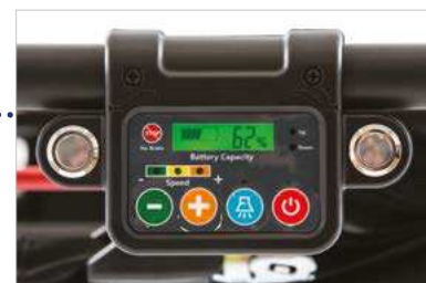
■ Quadro comandi Control panel