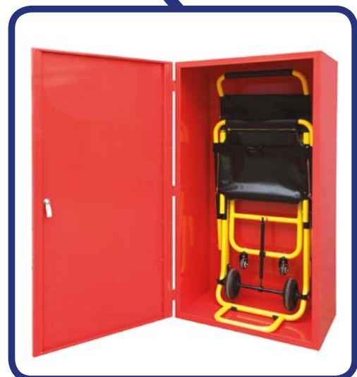
■ Cover Cover per fissaggio a muro Cover Cover for standing against the wall