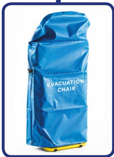
■ Cover Cover per fissaggio a muro Cover Cover for standing against the wall